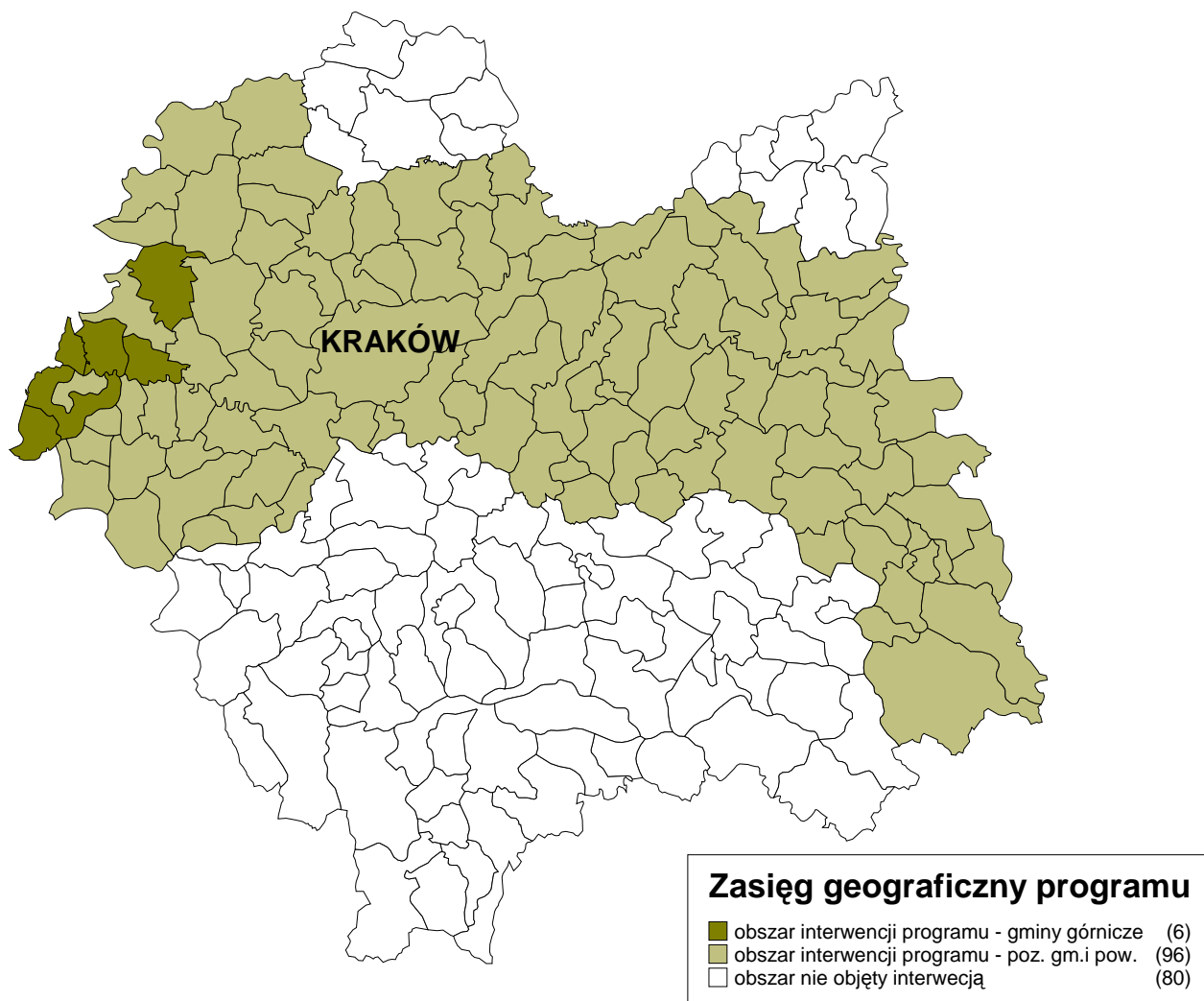
Mapa 1: Obszar interwencji Programu

Kryteria te pozwoliły wyselekcjonować powiaty objęte Programem: bocheński, brzeski, chrzanowski, gorlicki, krakowski, olkuski, oświęcimski, proszowicki, tarnowski, wadowicki, wielicki oraz miasta Kraków i Tarnów. Obszarem szczególnie preferowanym są gminy górnicze: Babice, Brzeszcze, Chełmek, Libiąż, Oświęcim – gmina wiejska oraz Trzebinia, gdzie skutki restrukturyzacji sektorów tradycyjnych są najbardziej dotkliwe.