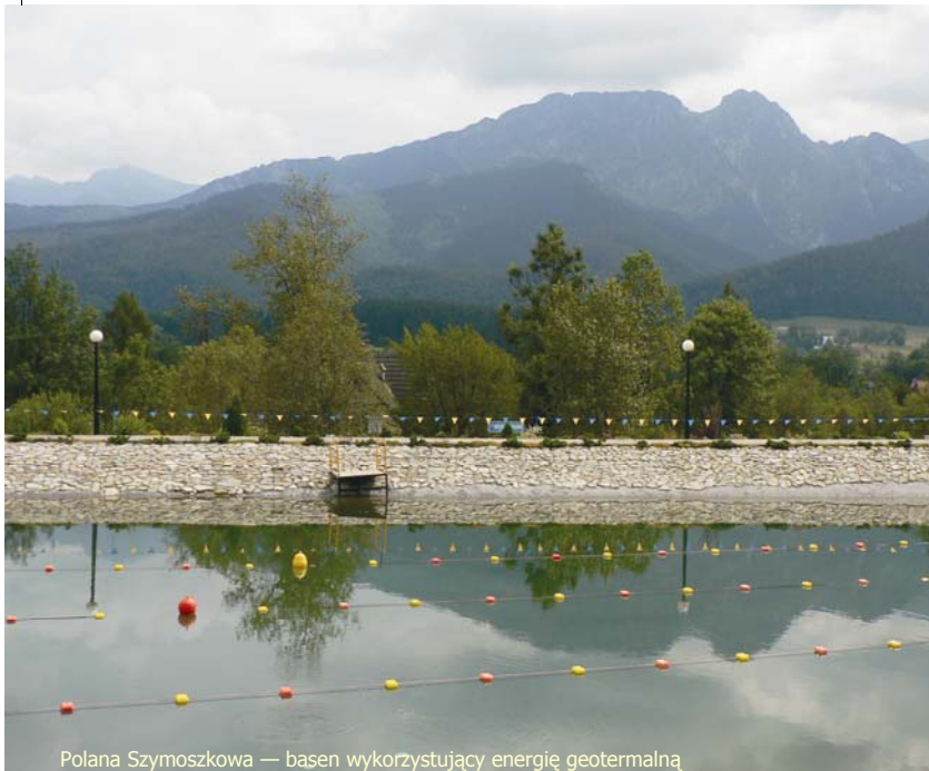
Polana Szymoszkowa — basen wykorzystujący energię geotermalną