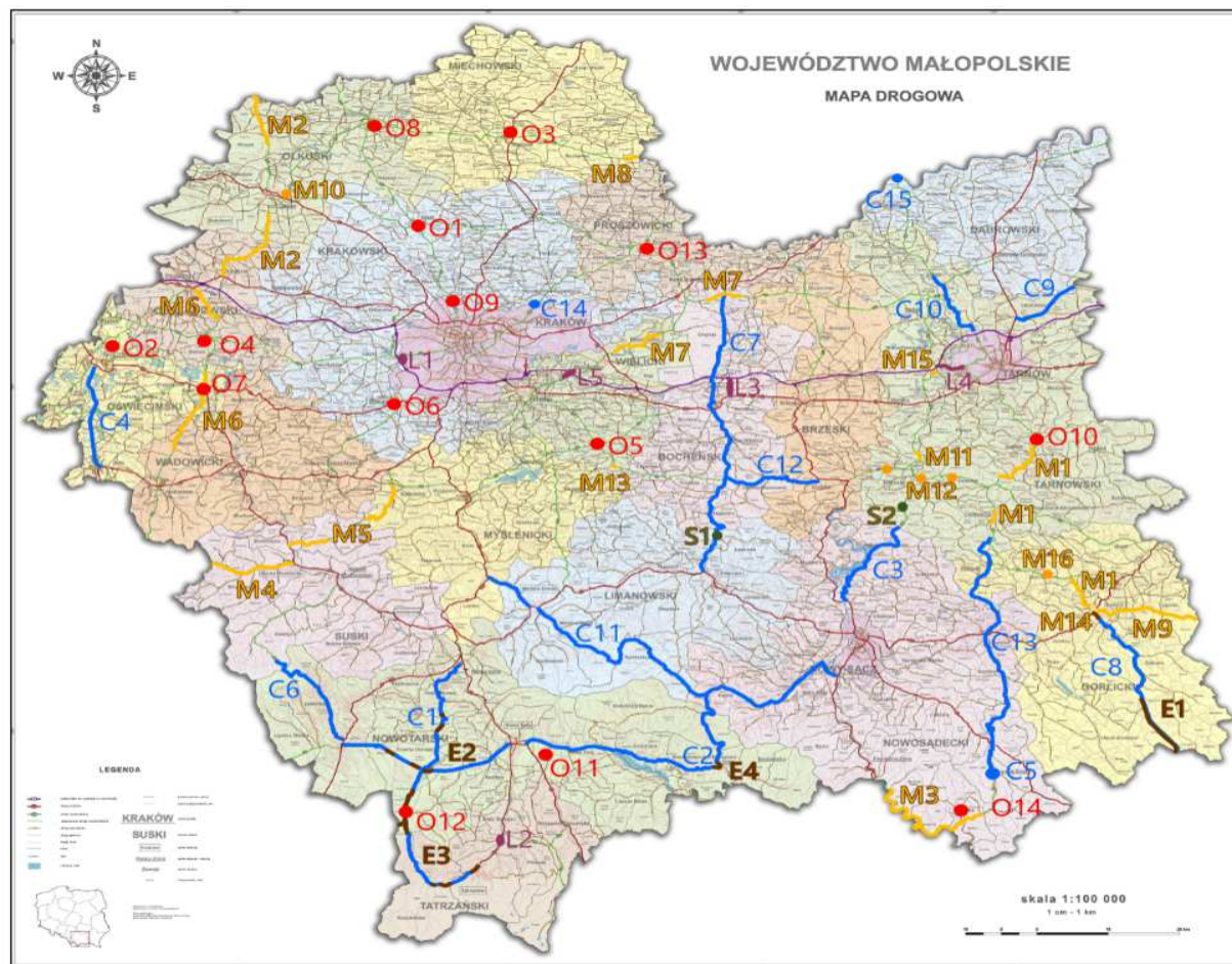
Rys. 2. Planowane inwestycje drogowe w Małopolsce do roku 2023