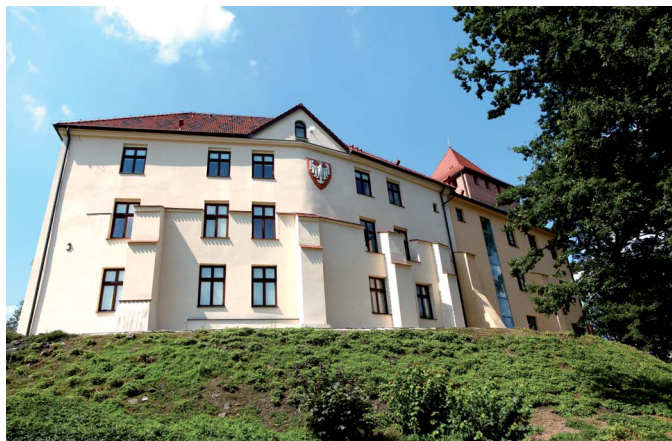
Zamek w Oświęcimiu