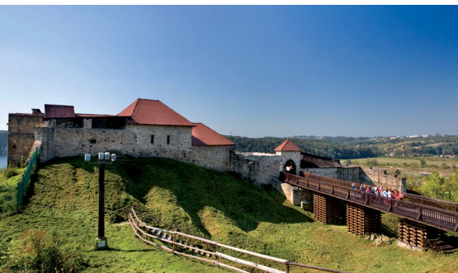
Ruiny zamku w Dobczycach