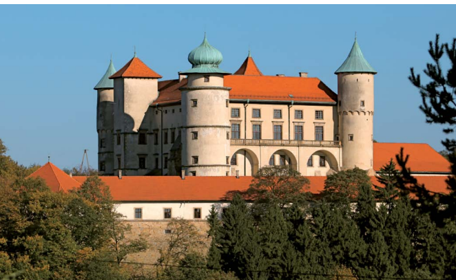
Zamek w Nowym Wiśniczu