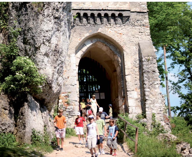
Zamek w Ojcowie