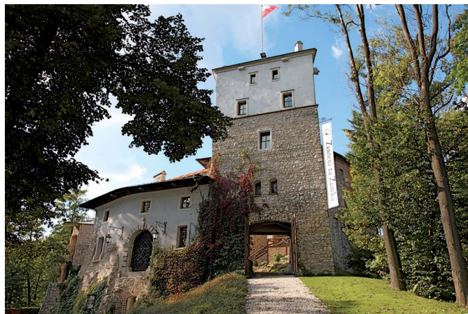
Warownia w Korzkwi

Jaskinia Łokietka , gdzie według legendy przyszedł władca Polski ukrywać się przed wojskami króla czeskiego Wacława II, udostępniona do zwiedzania od maja do października.