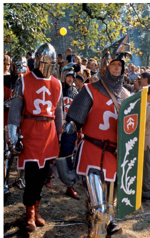
Turniej rycerski

Nowy Wiśnicz, gdzie na wzgórzu w pobliżu zamku wznosi się forteca bastionowa z XVII w. – dawny klasztor Karmelitów, a obecnie więzienie. Drewniany dwór Koryznówka z muzeum pamiątek po Janie Matejce