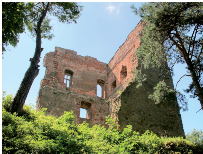
Ruiny zamku w Melsztynie

Nowy Sącz , gdzie warto przespacerować się po starym mieście, rozciągającym się zaraz obok terenu dawnego zamku. Są tu liczne zabytkowe kamieniczki, kościoły oraz interesujące Muzeum Okręgowe. Na skraju miasta znajduje się Sądecki Park Etnograficzny – największy skansen w Małopolsce.