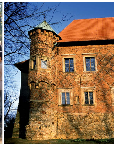
Zamek w Dębnie