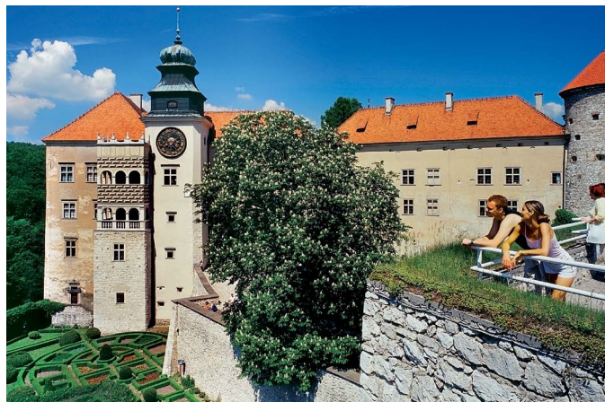
Zamek w Pieskowej Skale

Puszcza Niepołomicka , ogromny kompleks leśny, przez który poprowadzono liczne szlaki turystyczne.