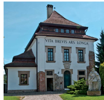
Dwór Karwacjanów