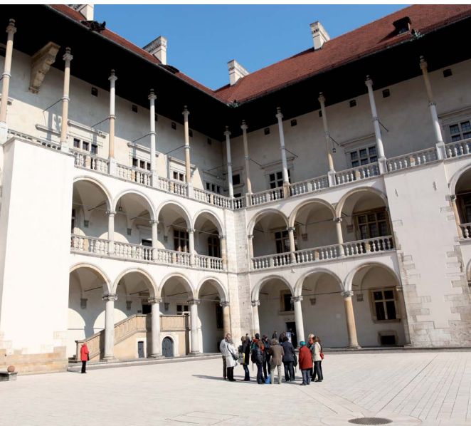
Dziedziniec zamku wawelskiego, fot. M. Zaręba Głowy wawelskie i dzwon Zygmunta, fot. M. Zaręba