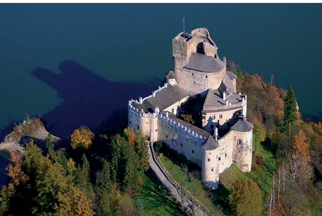
Zamek Dunajec