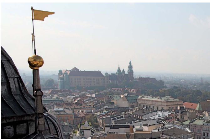
Wzgórze wawelskie z wieży kościoła Mariackiego

Z amki i zamczyska, ruiny średniowiecznych fortec i magnackie rezydencje doby renesansu i baroku spotykamy w Małopolsce niemal na każdym kroku. Budowano je najczęściej na wysokich, widocznych z daleka wzgórzach, dzięki czemu stanowią one z najbarziej charakterystycznych elementów krajobrazu w regionie.