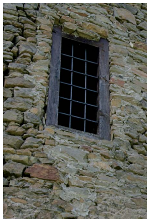
Ruiny zamku w Czchowie