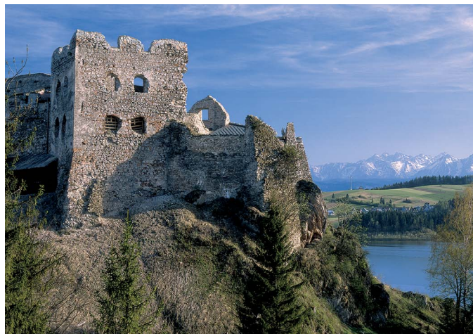
Zamek Wronin, fot. arch. UMWM

Pieniński przełom Dunajca najlepiej zobaczyć podczas spływu z doświadczonymi, górskimi flisakami, którzy na drewnianych tratwach zgrabnie przemijają pośród głazów i skalnych urwisk Trzech Koron czy Sokolicy. Spływ zaczyna się w Sromowcach Wyżnych-Kątach i kończy w Szczawnicy-Zdroju lub Krościenku.