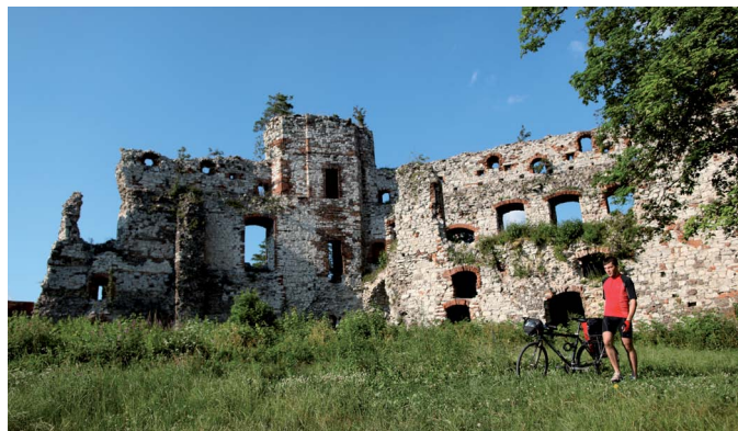
Zamek Tęczyn

Pustynia Błędowska , jedyny tego typu obszar w Polsce, atrakcyjny teren pieszych wędrówek.