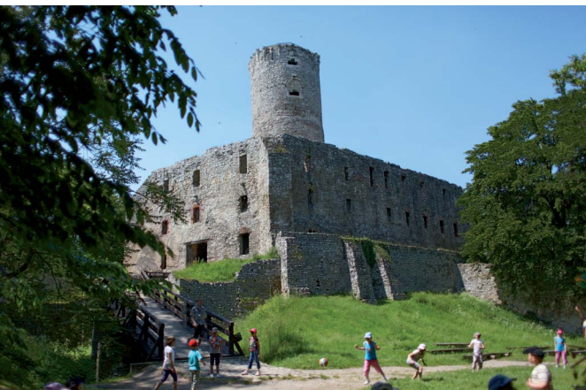
Zamek Lipowiec