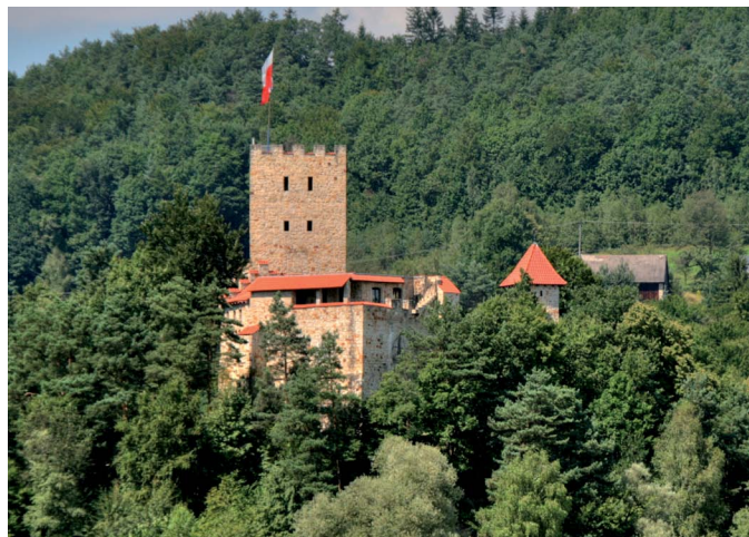
Zamek Tropszyn

Czchów , gdzie przy rynku i pobliskich uliczkach stoi sporo XVIII-wiecznych domów z malowniczymi podcieniami, wspartymi na drewnianych filarach, a w gotyckim kościele parafialnym zachowały się fragmenty romańskiej świątyni z XIII w. i resztki polichromii z XIV/XV w.