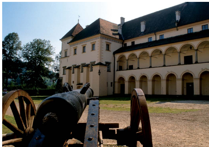
Zamek w Suchej Beskidzkiej

Skansen w Dobczycach znajdują się tuż przed zamkiem, na stoku wzgórza, i obejmujący kilka urokliwych starych drewnianych budynków, w tym m.in. okazałą karczmę.