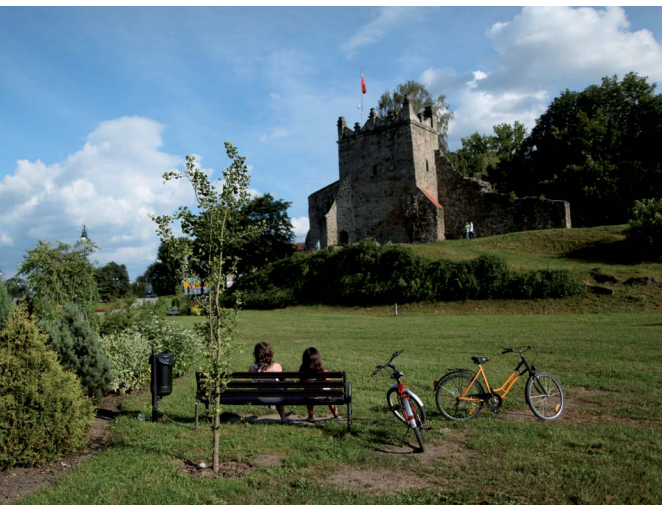
Ruiny zamku w Nowym Sączu, fot. M. Zaręba