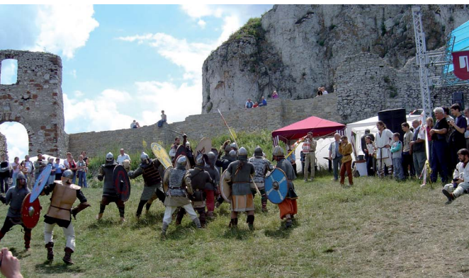
Turniej rycerski na zamku w Rabsztynie