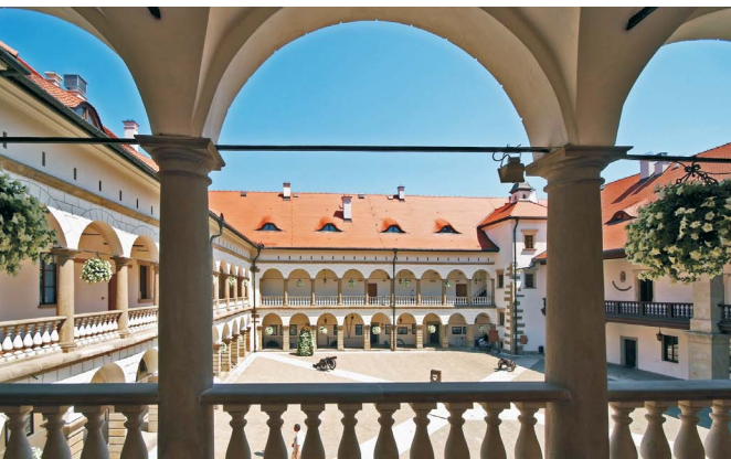
Zamek w Niepołomicach