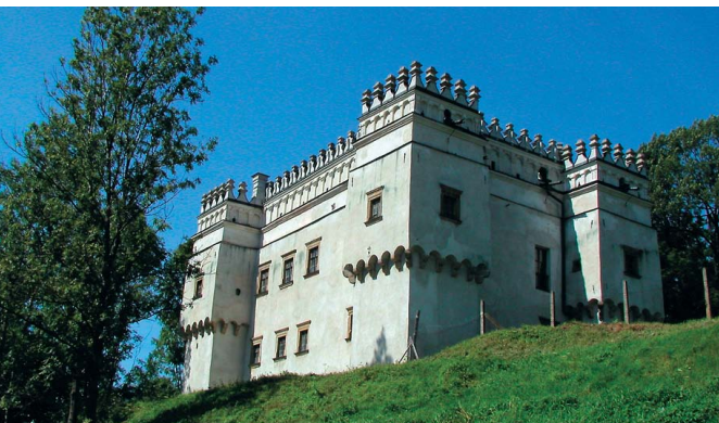
Kasztel w Szymbarku