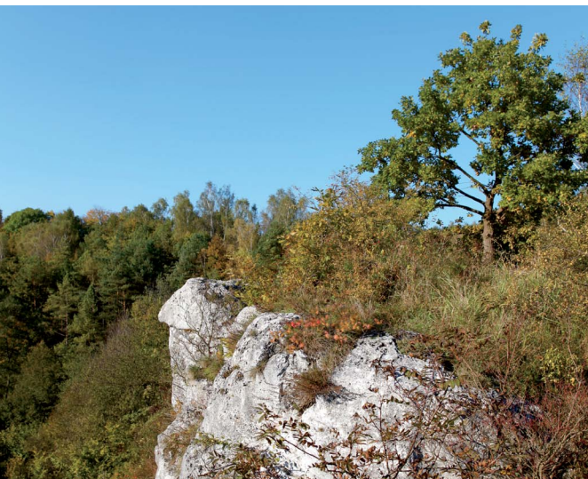
Skala zamkowa w dolinie Kluczwody, fot. M. Zaręba W Jaskini Wierchowskiej Górnej, fot. M. Zaręba