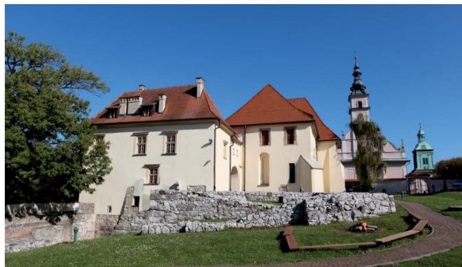
Zamek żupny

Nadwiślański Park Etnograficzny w Wygieźłowiu zajmuje ponad 5 ha terenu, na którym zgromadzono 25 zabytków budownictwa drewnianego, reprezentujących głównie architekturę Krakowiaków zachodnich.